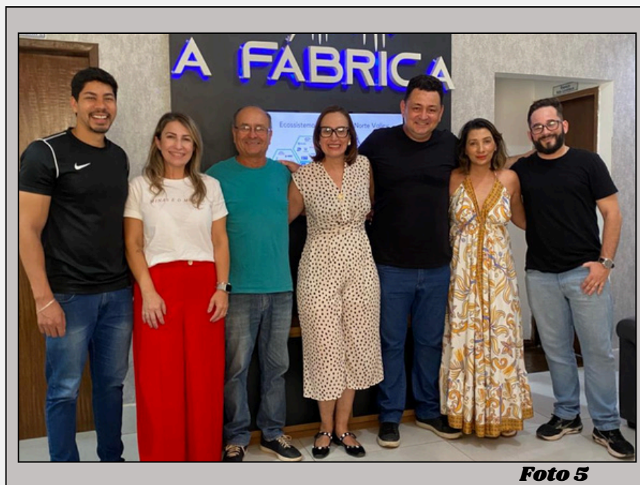
Foto 5 - Visita dos empreendedores do Edital Catalisa