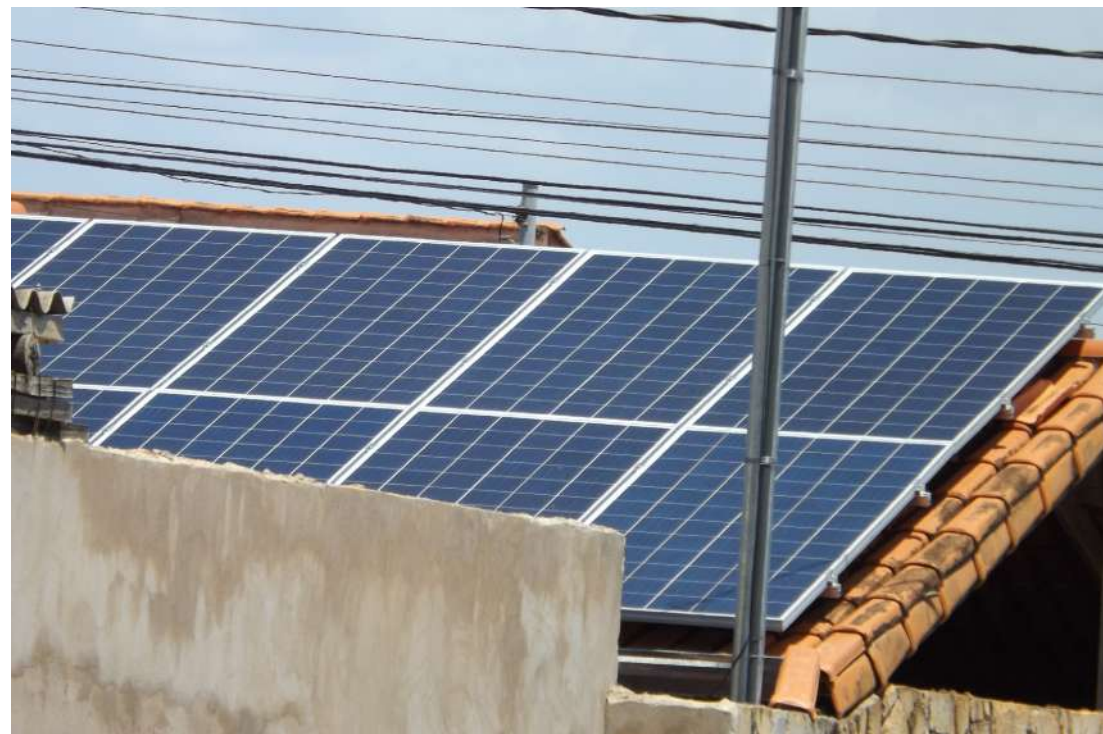
MEDIDA Provisória do Ministério da Fazenda poderá ser desastrosa para a micro e minigeração de energia solar

"Vai ser um desastre para o mercado. Quem já tem o sistema vai ser impactado diretamente, porque vai ver sua conta aumentar, e quem não tem o sistema, simplesmente não vai instalar, vai deixar o governo tocar, e não vai mais contribuir para diminuir o peso em cima do sistema.