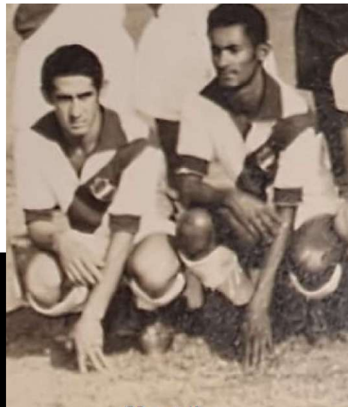
GARRINCHA e Durvalino. Estádio João Rebello. Foto: 1970