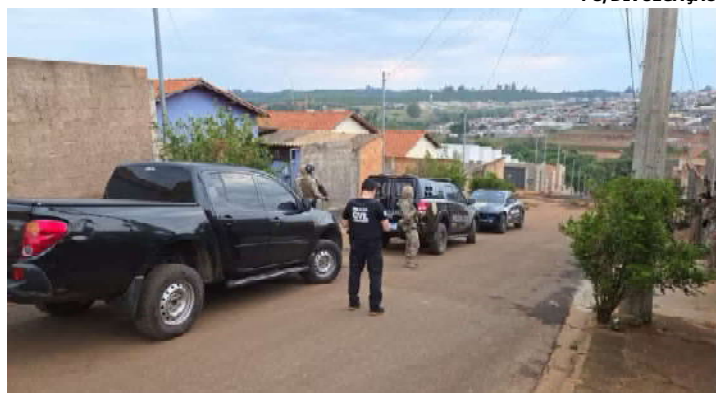
Operação Disciplina KZ cumpriu mandados em cinco cidades de Minas

A Polícia Civil deflagrou na manhã dessa quinta-feira (30/10), a operação 'Disciplina KZ', com o cumprimento de 25 mandados judiciais, sendo 12 de prisões preventivas e 13 de busca e apreensão. A ação aconteceu em Montes Claros e nas cidades de Campos Altos, Ibiá, Araxá e São Gotardo, no Triângulo Mineiro.