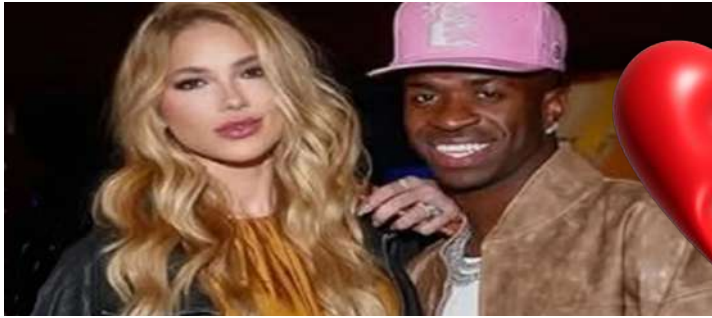
Vini Jr. dá presentes para filhos de Virginia Fonseca