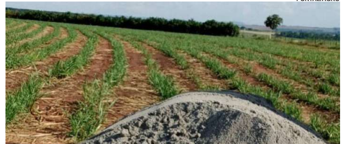
Diagnóstico completo é o primeiro passo para lavouras mais produtivas

O planejamento do solo deve abranger todo o sistema produtivo, não apenas uma cultura