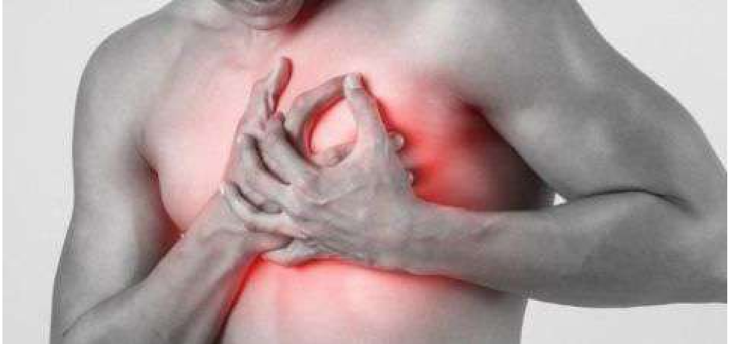
Procedimento diagnóstico e terapêutico desobstrui artérias coronárias e reduz risco de sequelas graves

O infarto agudo do miocárdio continua entre as principais causas de morte no Brasil. Segundo o Ministério da Saúde, o país registra de 300 mil a 400 mil casos por ano, com taxas de mortalidade que podem chegar a 30% quando o atendimento é tardio. Nesse cenário, o cateterismo cardíaco, exame e tratamento realizado por via minimamente invasiva, permanece como uma das ferramentas mais eficazes para reduzir complicações e salvar vidas.