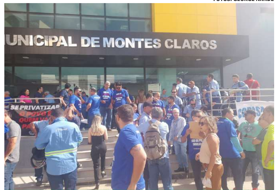
COPASIANOS e eletricitários de Montes Claros vão participar do ato