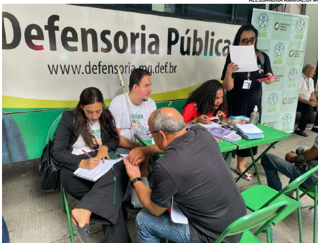
Decisão atende pedido da Defensoria Pública de Minas Gerais; município tem 60 dias para estruturar rede multidisciplinar e apresentar plano de ação

A situação é agravada pela distribuição dos atendimentos estaduais entre Mirabe-