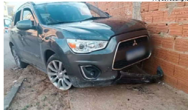
Suspeito foi contido após perder o controle e subir em calçada

Um jovem (22 anos) foi preso em flagrante após furtar um carro e ser perseguido pela Polícia Militar, em Montes Claros, nessa quarta-feira (29/10). Durante a fuga, ele jogou o veículo contra motocicletas da PM e tentou atropelar os policiais. O automóvel havia sido furtado da garagem de uma casa no Bairro Santa Rita. O morador contou à polícia que chegou em casa para almoçar e, ao retornar do descanso, percebeu o furto.