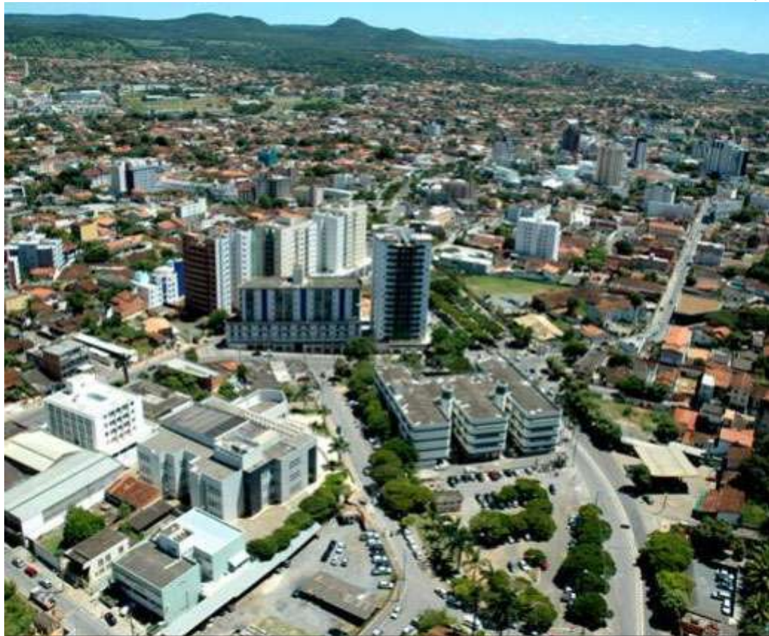
MONTES CLAROS recebeu quase R$ 120 milhões de repasses do Fundo de Participação neste ano