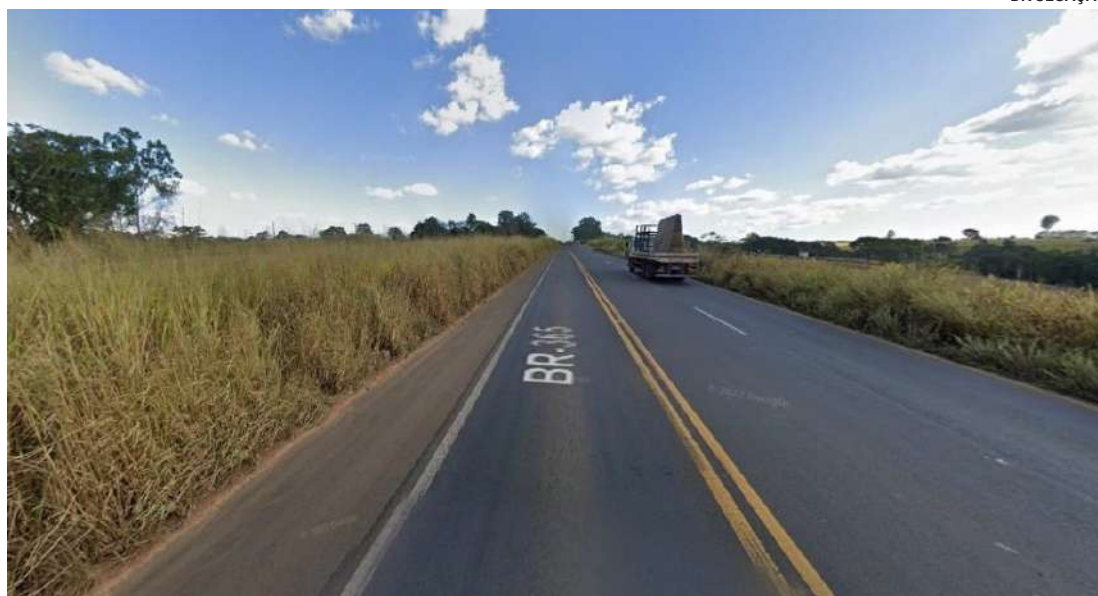
SEINFRA realiza audiência hoje na Amams para discutir projeto de concessão da BR-135

O evento integra o processo de consulta pública aberto pelo Governo de Minas sobre o Lote Rodoviário Noroeste, que prevê investimentos expressivos em melhorias nas rodovias da região, incluindo duplicações, implantação de acostamentos e asfaltamento de estradas não pavimentadas. A BR-365 é considerada uma das mais estratégicas do Estado, por conectar o Sul e o Nordeste do Brasil. A rodovia é amplamente utilizada no transporte de cargas e grãos, servindo de rota para caminhoneiros que saem da região de Ribeirão Preto (SP), passam por Uberlândia, Pirapora e Montes